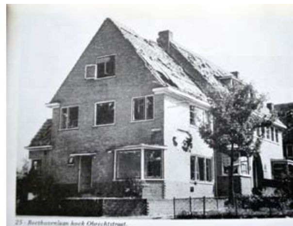
23 - Beethovenvaan Ass & Obrechtstraat.

Natuurlijk zijn er vele herinneringen aan het wonen in dit huis op het hoekje gedurende meer dan een halve eeuw,