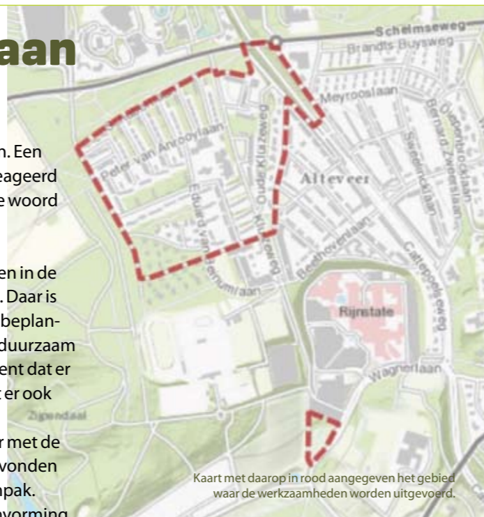
Kaart met daarop in rood aangegeven het gebied waar de werkzaamheden worden uitgevoerd.

Een bijzonder geval is het groen in de omgeving van de Viottastraat. Daar is een echte omvorming van de beplanting nodig om de bosstroken duurzaam in stand te houden. Dat betekent dat er bomen gekapt worden én dat er ook nieuwe aanplant plaatsvindt. Afgelopen voorjaar is hierover met de aanwonenden in een aantal avonden gecommuniceerd over de aanpak. Vanwege deze benodigde omvorming heeft de gemeente voor de werkzaamheden rondom de Viottastraat een vergunning aangevraagd. De uitvoeringskaart kunt u ook inzien op de gemeentelijke website onder uw wijk.