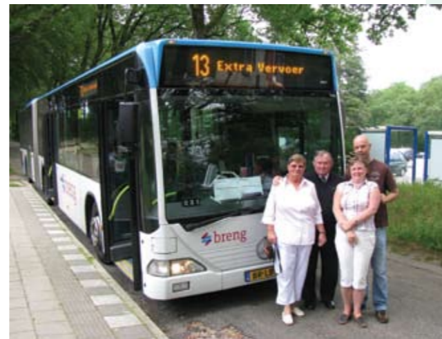
Craneveer • Jaargang 44 • Nummer 4