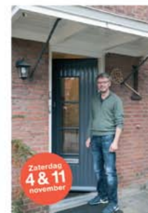
David Mozartstraat 15 ■ Spouwmuurisolatie ■ Zonnepanelen ■ Zonnecollector ■ HR++ glas met coating ■ Lage temperatuur verwarming ■ LED verlichting ■ Elektrische auto ■ Opvang regenwater