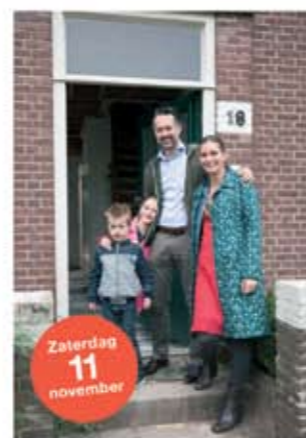
Michel Lisztstraat 18 ■ Hoe verbouw je naar gasloos wonen?