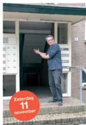
Frank Debussystraat 7-1 ■ Energiebesparende maatregelen en de mogelijkheden binnen een VVE