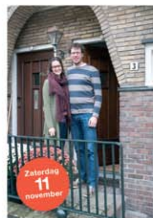
Maarten Sweelinklaan 3 ■ Vloerisolatie ■ Dubbel glas met karakter ■ 50% minder verbruik door slim gebruik van apparaten