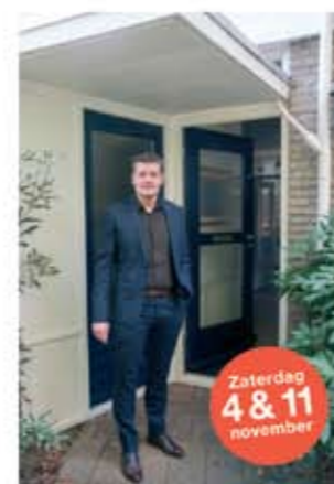
Jeffrey Helena Coetsstraat 10 ■ Zonnepanelen ■ Warmtepomp