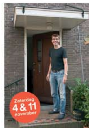
Sjoerd Palestrinastraat 28 ■ Spouwmuurisolatie ■ Zonnepanelen