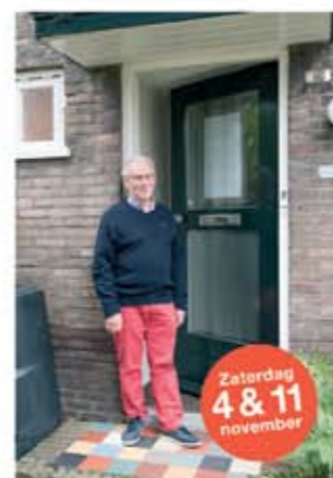
Jan Obrechtstraat 10 ■ Spouwmuurisolatie in een jaren '30 huis