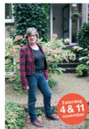
Gerda Ravelstraat 8 ■ Zonnepanelen met warmte terugwinning (met Solar Energy Booster)