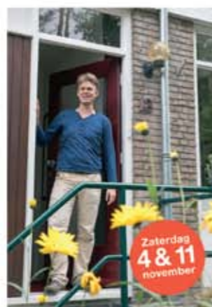
Rob Slothouberstraat 13 ■ Vloerverwarming ■ HR++ glas

Elf buurtgenoten vertellen je graag over de energiebesparende maatregelen in hun huis. Zij beantwoorden vragen als: Wat bevat en wat niet? Waar moet je op letten? Wat heeft het gekost en wie heeft het uitgevoerd? Meld je aan voor één of meerdere bezoeken aan deze duurzame huizen. Je bent van harte welkom!