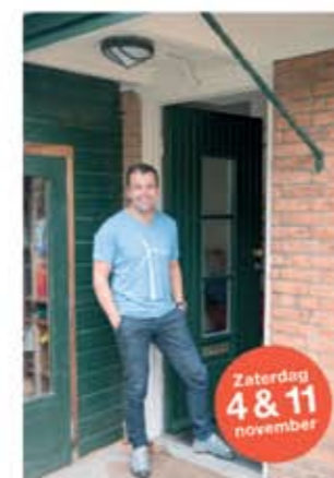
Daniël Sweelinklaan 7 ■ Zonnepanelen ■ Spouwmuurisolatie ■ HR++ glas

Ook interesse in zonnepanelen en isolatie?