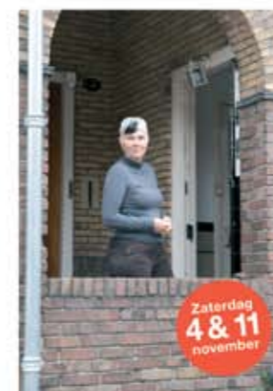
Didi Sweelinklaan 2 ■ Zonneceldakpannen