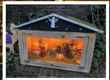
Kerststal in boekenkastje...