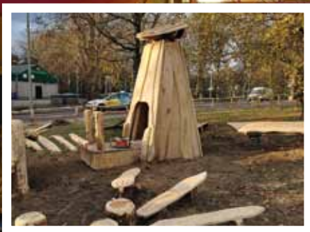
Het Aardvarken is klaar!

Lichtjesactie Rijnstate Vriendenfonds levert ruim 20.000 euro op!