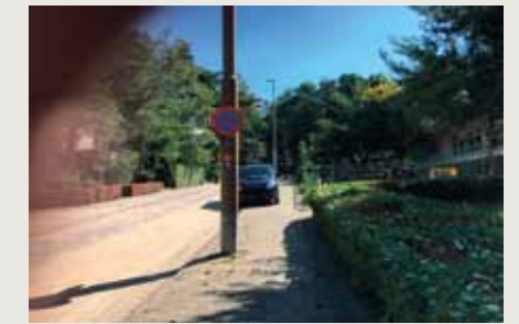
Peter van Anrooylaan